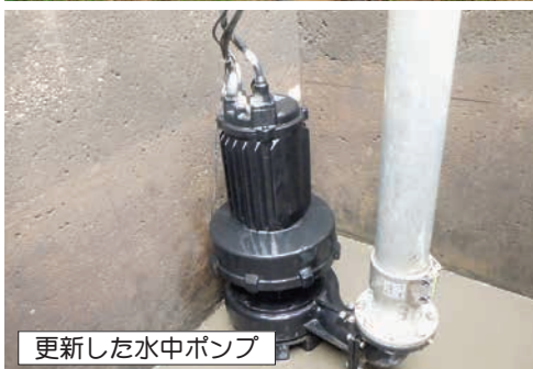
更新した水中ポンプ

当地区 約29.3haをかんがいする揚水機は、昭和54年に整備されましたが、耐用年数の経過により老朽化が著しく、揚水能力が低下していました。本事業により揚水機(水中ポンプ)を1台と場内配管を更新し、安定した用水量を確保することを目的として実施しました。