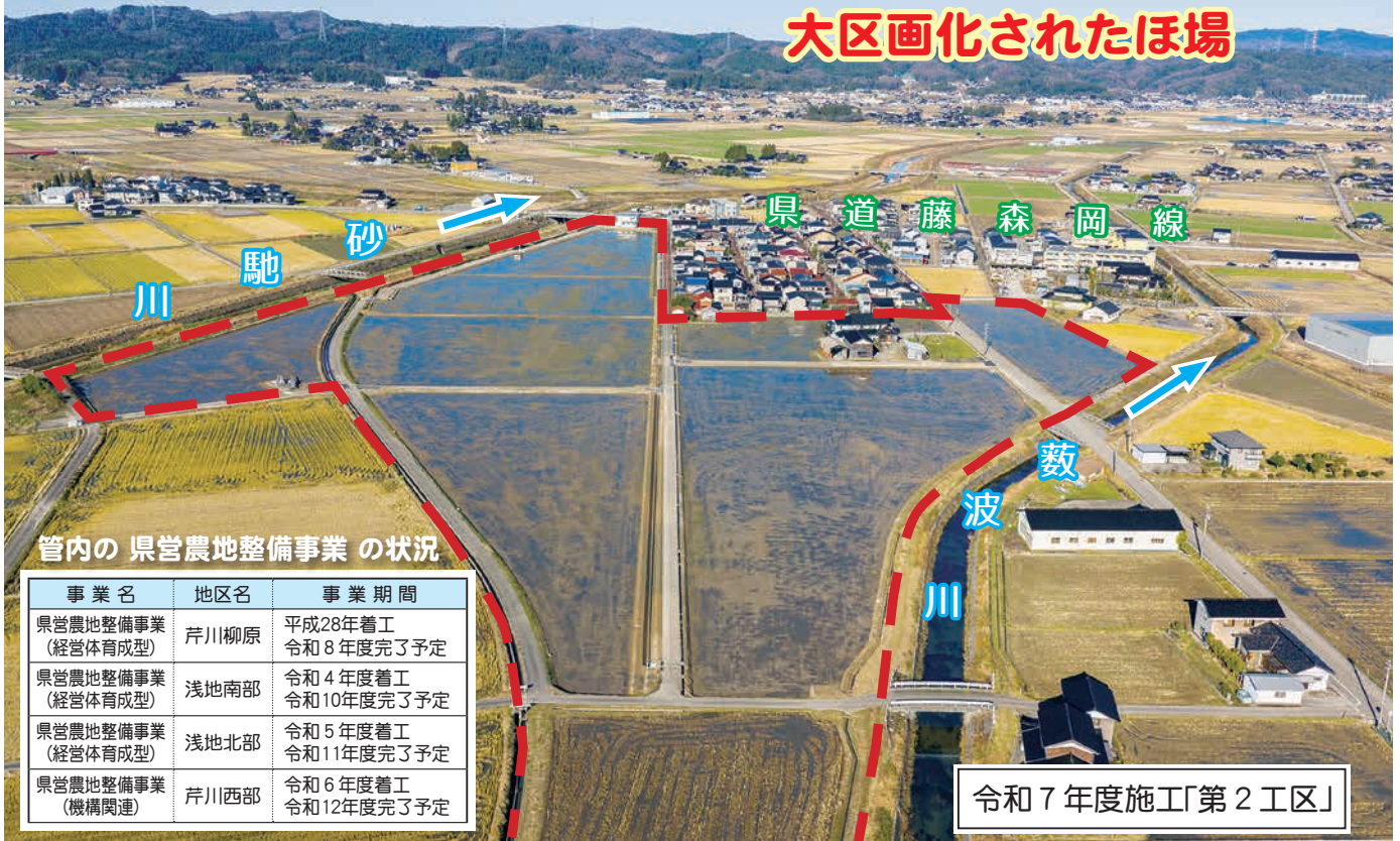
管内の 県営農地整備事業 の状況